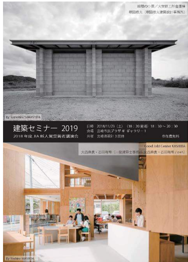
(公社)日本建築協会九州支部宮崎地域会 協会員名簿