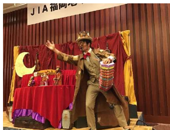
ピエロクッキー座の人形劇