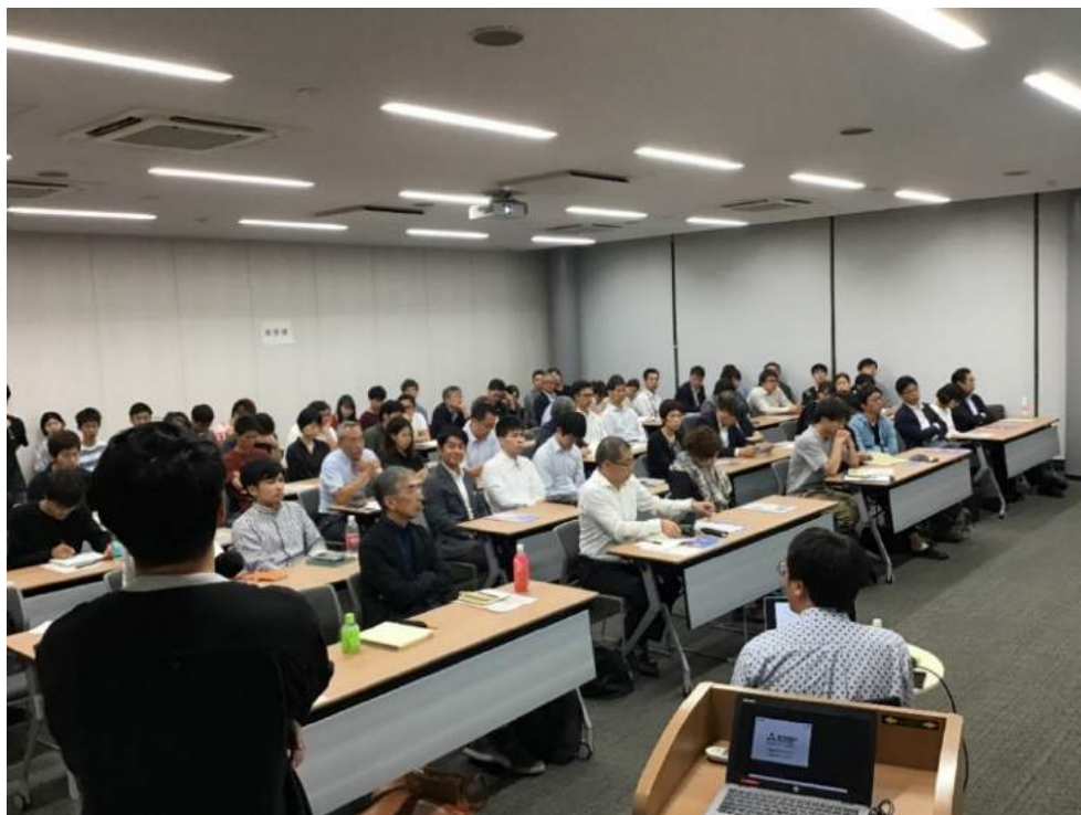
7月例会 風景 近年で最多の参加者