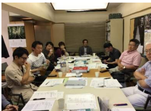
地域会役員会風景