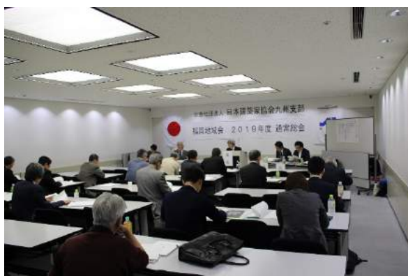
福岡地域会通常総会風景