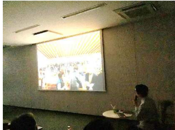
例会風景@アイカ工業福岡支店